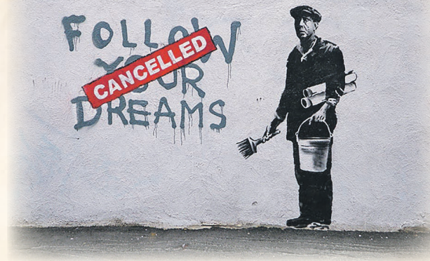
Dibujo de Banksy en Boston

Espero que cada uno obtenga lo que merece de todo esto y que lo disfrute en 2021. ✍️